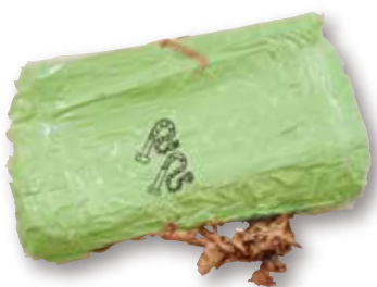
● 荒井陸 / 「掃除機と掃除機」 数十個の様々な種類のテープ、ペン、パネル