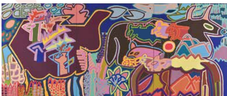
● 山野将志 / 「富士山の山のくじらぐも 角はえた鹿の群れと大きな黒い牝牛」 アクリル、キャンバス

※「エイブル・アート展」は障がいのある人たちが生の証として生み出した作品を「可能性(able=エイブル)の芸術」として紹介する展覧会です。