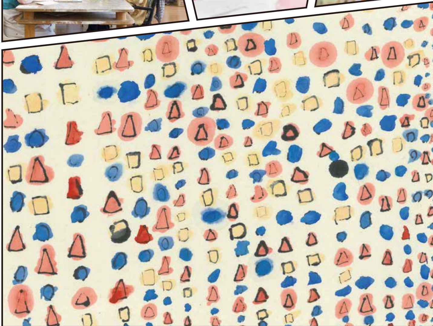
「花畑」水彩、墨、和紙 前田孝美