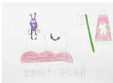
● 平井和樹 / 「虫歯の日(6/4)まであと6日」 色鉛筆、鉛筆、紙