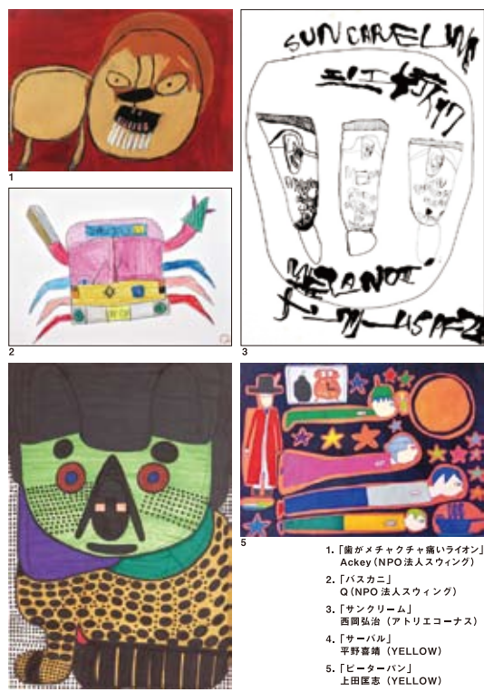
1. 「誰がメチャクチャ面白いライオン」 Ackey (NPO法人スウィング) 2. 「バスカニ」 Q (NPO法人スウィング) 3. 「サンクリーム」 西園弘治 (アトリエコーナス) 4. 「サーバル」 平野青楠 (YELLOW) 5. 「ピーターパン」 上田匡志 (YELLOW)

今回は大阪／中之島・北浜界隈を舞台に、「違って、独特」なアーティストたちを紹介し、さらに、障がいのある人のあたらしい「しごと観」を提案する展覧会やシンポジウムを開催します。アートは生きていることが幸福でありたいと願う、人間の基本的な営みです。このプロジェクトをとらえて、働くこと、暮らすこと、そして生きることをいっしょに考えてみませんか？