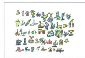
「Inspiration シリーズNo.6」 山村晃弘