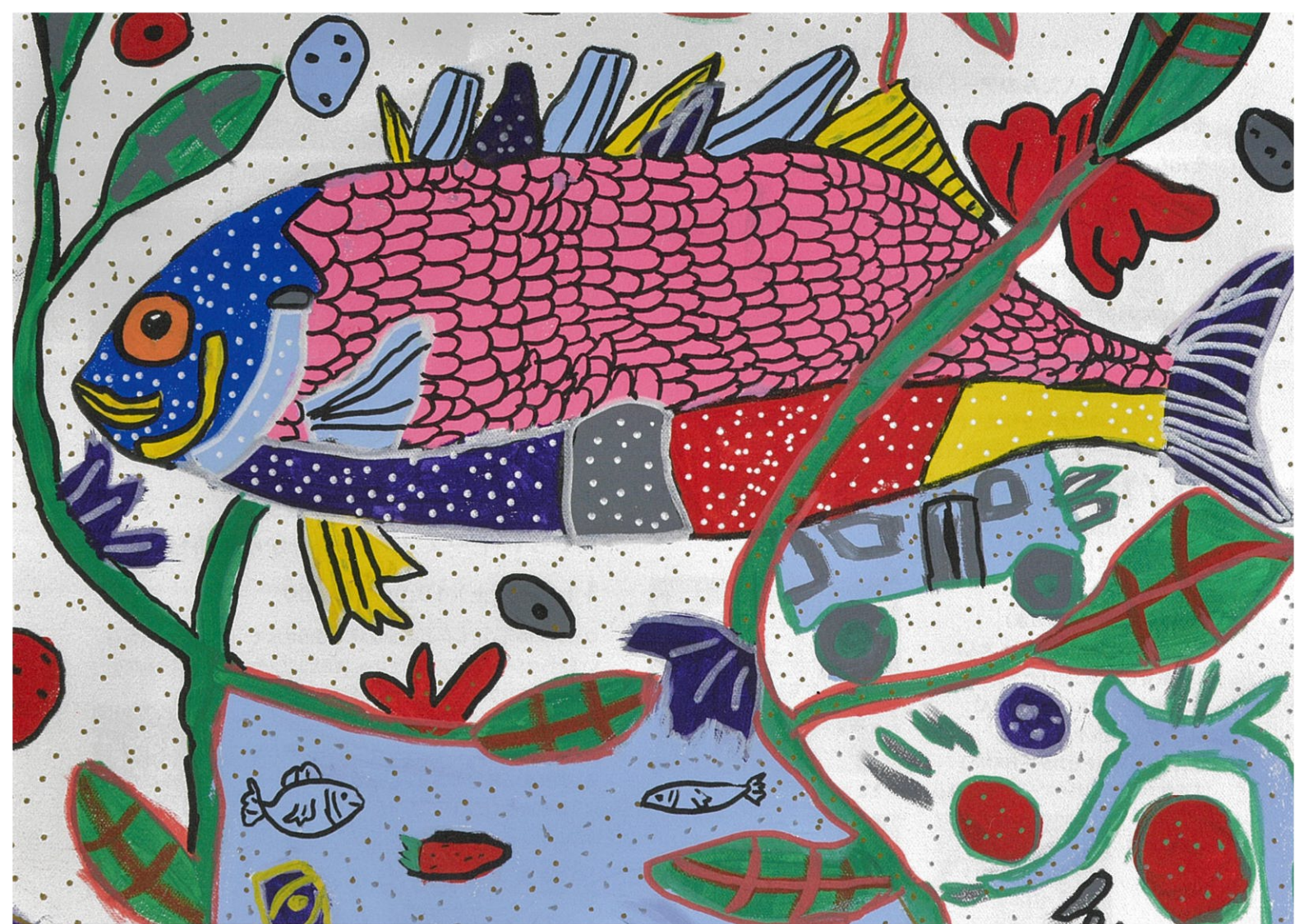
「さかなが、さいたので、いろいろです。」 風香