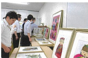
ならコープの職員とアート作品の「お見合い」の風景