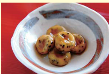
健康みたらし団子