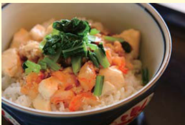
絹ごし豆腐のあんかけ丼